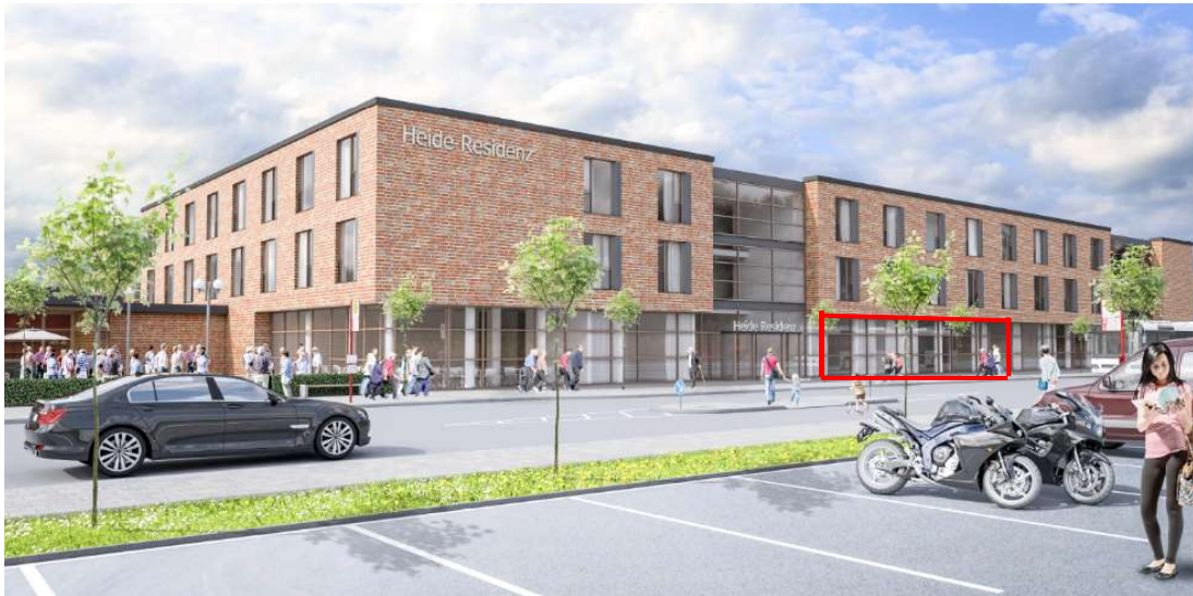
Altenpflegeheim in Stade-Riensförde